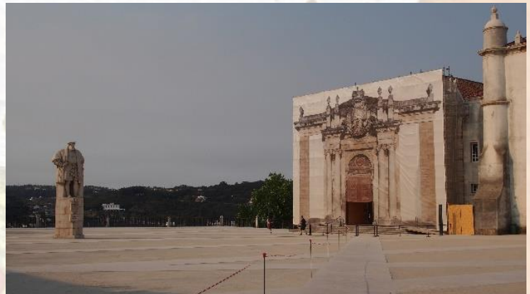
コインブラ大学の中庭。右の建物がジョアン5世図書館。

翻って、本学の水田記念図書館も、世界遺産にははならなくとも、教員や学生にとっての「魂の病院」として、私たちの心と脳に刺激を与え続けてほしいものである。